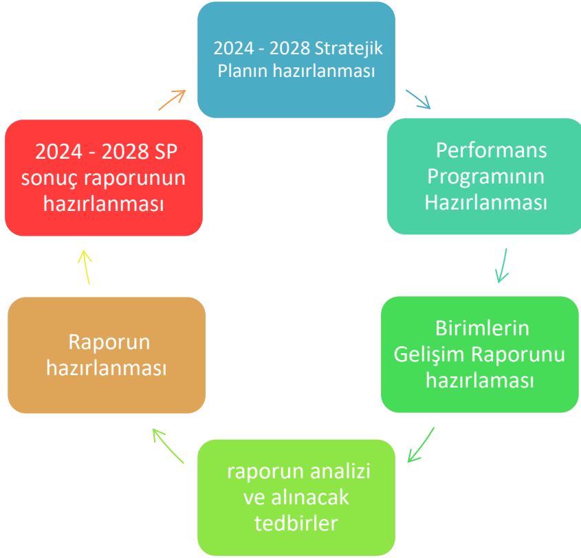
Şekil:3 İzleme ve Değerlendirme Süreci

Stratejik Plan yıl boyunca izlenerek yılda iki defa değerlendirilecektir. Stratejik plan kurumun beş yıllık hedeflerini planlamak amacıyla hazırlanmıştır.2024-2028 yıllarını kapsayan bu stratejik planın performans göstergelerine ulaşılabilmesi için yapılacak olan etkinlikler “performans programı” ile planlanır.